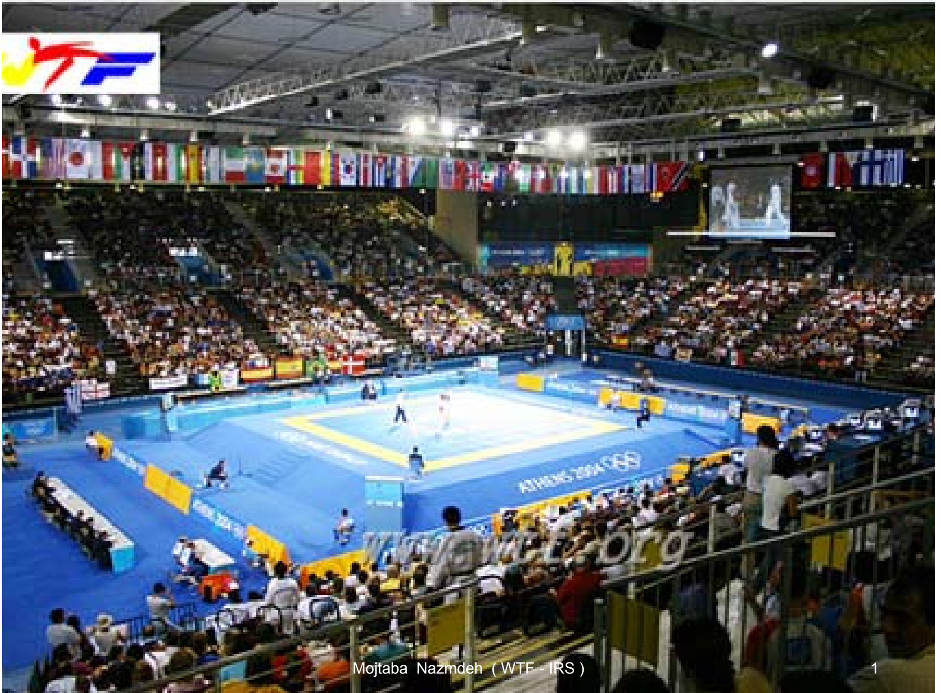
Mojtaba Nazmdeh (WTF - IRS)